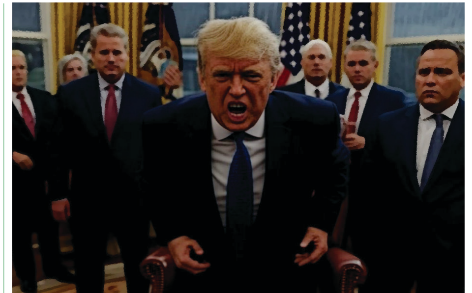
Trump | IA | Initiative-communiste.fr

Trump ne s'est pas «fait tout seul» Trump, lui, a grandi dans le Queens dans un milieu aisé, façonné par son mentor Roy Cohn, avocat de la mafia. Déterminé à ne jamais admettre l'échec, Trump a construit son empire sur des projets audacieux et