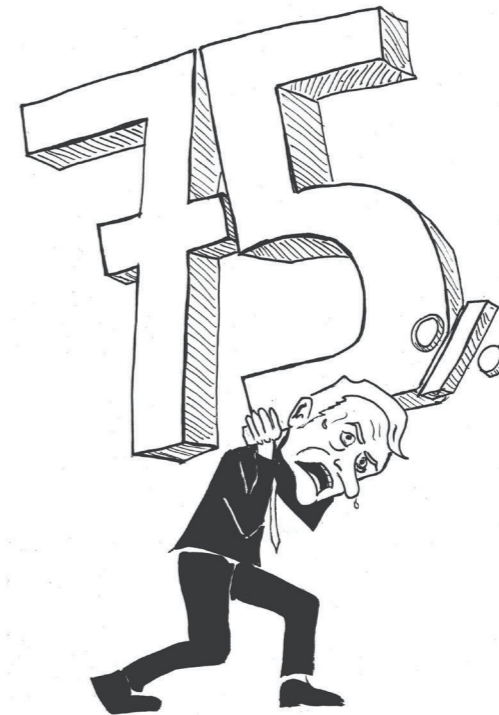
DES JEUNES FRANÇAIS HOSTILES AUX POLITIQUES GOUVERNEMENTALES MACRONISTES

dialisation capitaliste que porte le marché unique européen réside justement dans la libre circulation des marchandises et des capitaux à tout prix. Autrement dit dans la dérégulation de l'économie de marché.