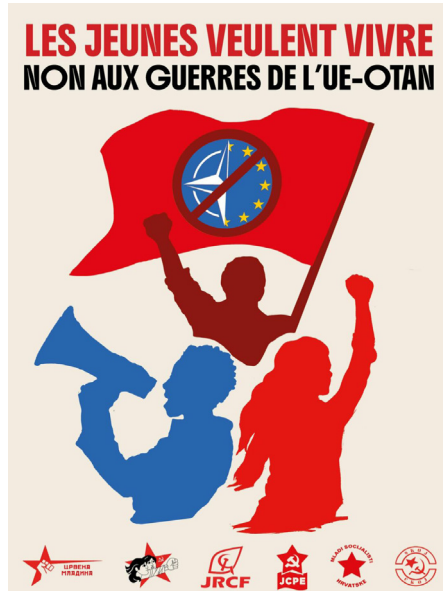
Affiche de campagne JRCF

Depuis plusieurs mois, les Jeunes pour la Renaissance Communiste en France (JRCF) mènent une campagne nationale offensive pour la paix, contre l'Union européenne et l'OTAN. Affiches, tracts, journal Jeunesse du Monde, prises de parole : la JRCF ne se contente pas de commenter l'actualité, elle agit concrètement pour dénoncer et combattre l'Alliance atlantique, cet instrument central de l'impérialisme-hégémonisme états-unien et de ses vassaux européens.